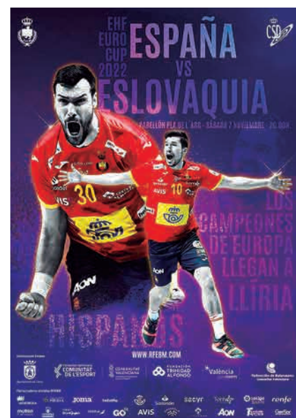
Cartel del partido España : Eslovaquia en Llíria.

Llíria acogerá el 7 de noviembre, a las 20:00 h. y en directo por Teledeporte, el encuentro que enfrentará a los Hispanos y a Eslovaquia, en la segunda jornada de la EHF EURO Cup 2022. La selección española visitará por primera vez la localidad valenciana, volcada con el balonmano español en los últimos tiempos gracias al inestimable apoyo del propio Ayuntamiento de Llíria y de la Fundación Trinidad Alfonso, dos grandes motores deportivos para la Comunidad Valenciana.