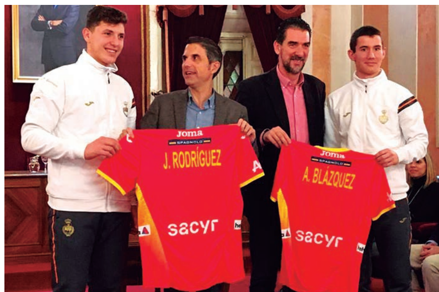
Recepción en el Ayuntamiento de Alcalá de Henares.