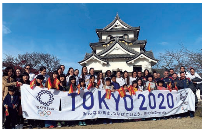
Las Guerreras, en su visita al Castillo Hikone.