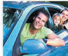
Alquiler de coches