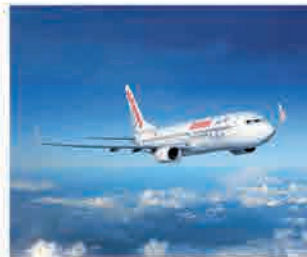
Billetes de avión y tren