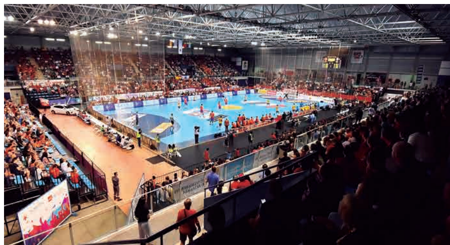
Almería quiere repetir el lleno absoluto del mes de junio, con 5.000 espectadores.

Será la última ocasión que tendrá la selección española para competir antes de iniciar su preparación para el Campeonato del Mundo de Japón 2019, a poco más de dos meses para que arranque esta gran cita en Kumamoto. Sin embargo, antes de aterrizar en territorio nipón, las Guerreras deberán encarrilar su pase al torneo continental que se disputará en diciembre de 2020 en Noruega y Dinamarca.