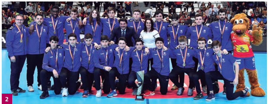
(1) Liberbank Cuenca fue la gran revelación de esta fase final en Alicante. (2) KH-7 Granollers, campeón de la Minicopa.