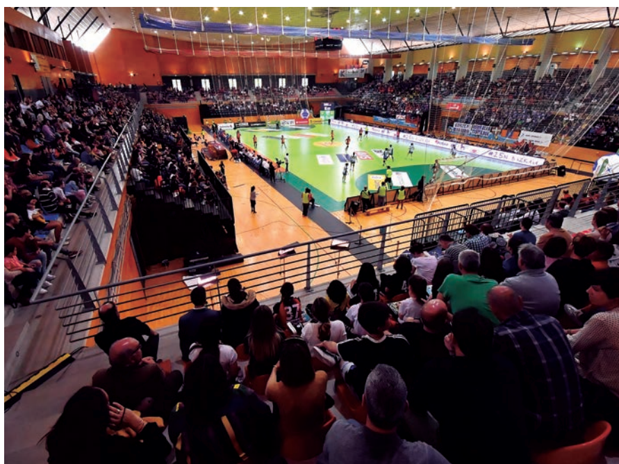
El Polideportivo Lasasarre batió el récord histórico de asistencia hasta en dos ocasiones.

Los primeros equipos en abrir fuego en Barakaldo fueron el hasta entonces vigente campeón, Liberbank Gijón, y Rincón Fertilidad Málaga. El duelo comenzó ajustado,