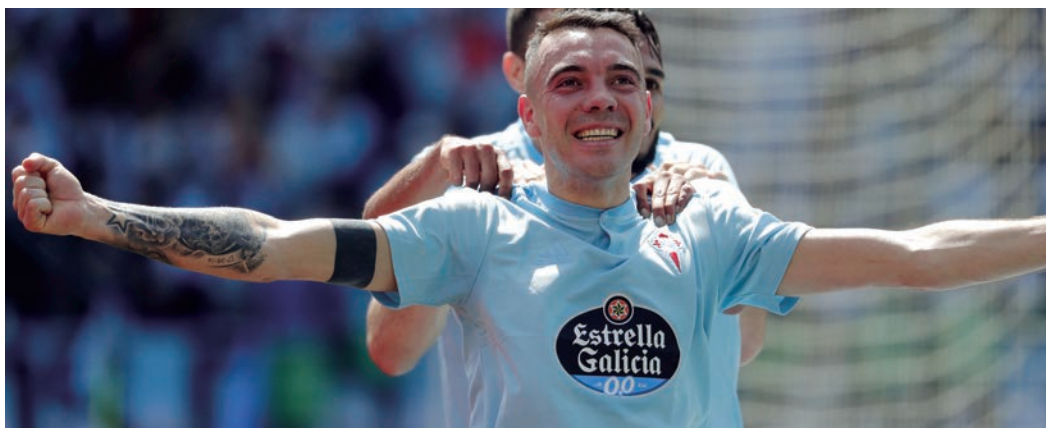
Iago Aspas, el formidable delantero internacional del Celta de Vigo, es uno de los grandes nombres de deportistas gallegos que brindan su apoyo al Campeonato del Mundo de Balonmano en Pontevedra y Vigo.

La Real Federación Española de Balonmano hacía pública el pasado 1 de abril la página web del Campeonato del Mundo de España 2019 en categoría Junior Masculina: