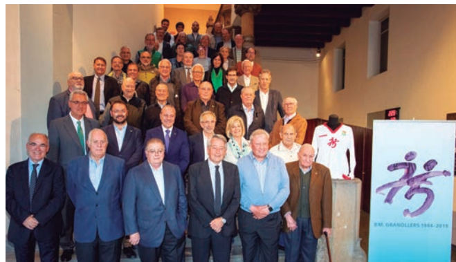
Representantes del mundo de la política y la gestión federativa acompañan a los dirigentes y ex jugadores del Club Balonmano Granollers en el acto del 75 aniversario de la entidad vallesana

Recordar que Granollers es una de las sedes del próximo Campeonato del Mundo de Balonmano Femenino 2021 , el primero que se celebra en España en toda historia.