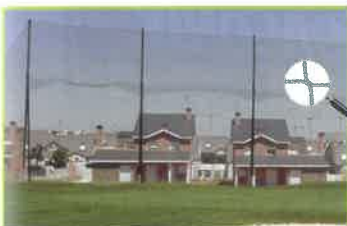
Redes de Protección

MATERIAL DEPORTIVO Fabricación y distribución