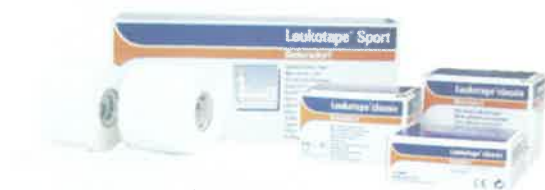
LEUKOTAPE CLASSIC STRAPPAL