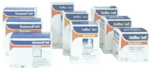
UNIFLEX GRIP UNIFLEX HAFT ELASTOMULL HAFT EASIFIX COHESIVE