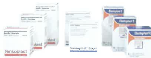
TENSOPLAST TENSOPLAST SPORT ELASTOPLAST-E