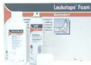
LEUKOSPRAY LEUKOTAPE REMOVER ARTIFOAM