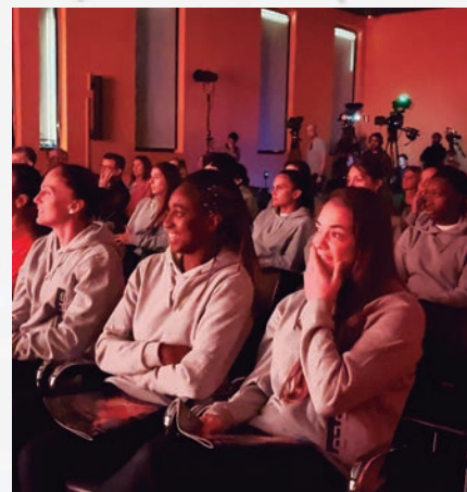
Las Guerreras ven por primera vez el spot 2022, 'Forjando una Leyenda'