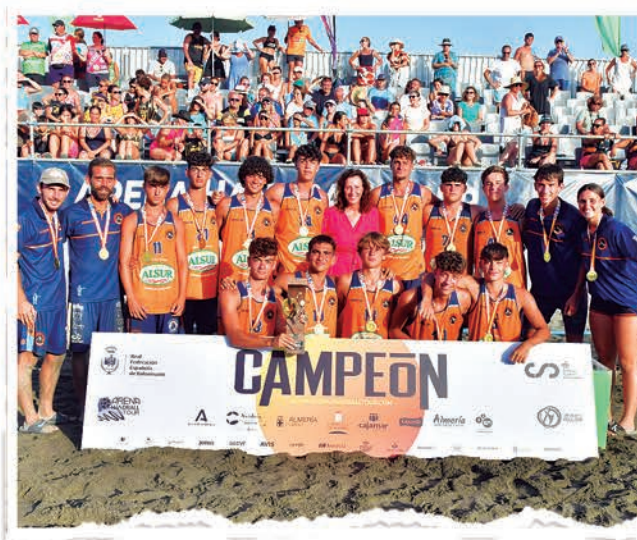
JUVENIL MASCULINO BMP MARAVILLAS BENALMÁDENA