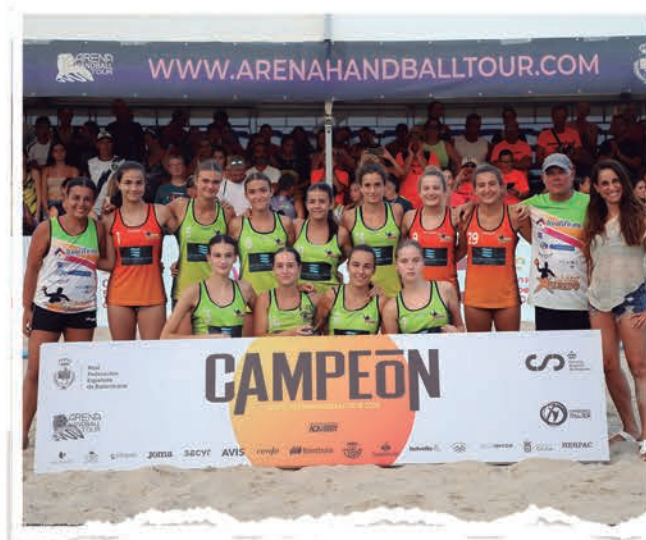
INFANTIL FEMENINO CLUB HANDBOL XÀBIA