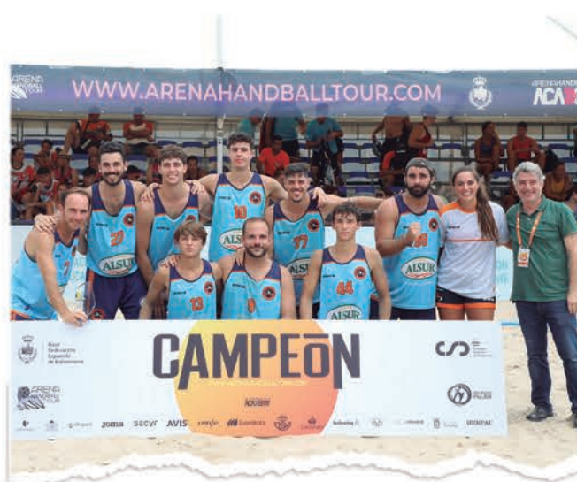
SÉNIOR MASCULINO BMP MARAVILLAS BENALMÁDENA