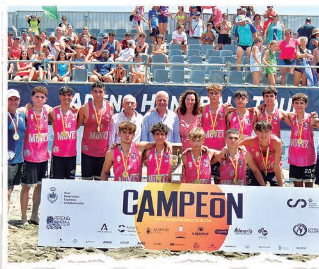
CADETE MASCULINO MOVEX GRANOLLERS