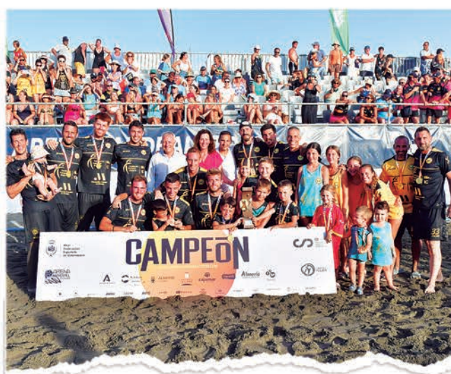
SENIOR MASCULINO CIUDAD DE MÁLAGA