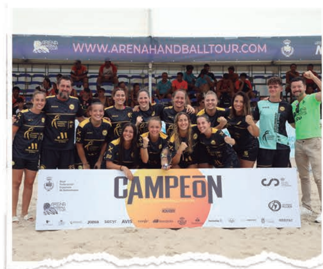
SÉNIOR FEMENINO FUNDACIÓN FOMENTO DEPORTE CIUDAD DE MÁLAGA.

En categoría senior, Málaga se colgó el oro en masculino y femenino: BMP Maravillas Benalmádena y Fundación Fomento Deporte Ciudad de Málaga, respectivamente, cerraron sendos oros este último Arena 1000 de la temporada.