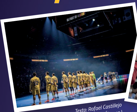
Texto: Rafael Castillejo