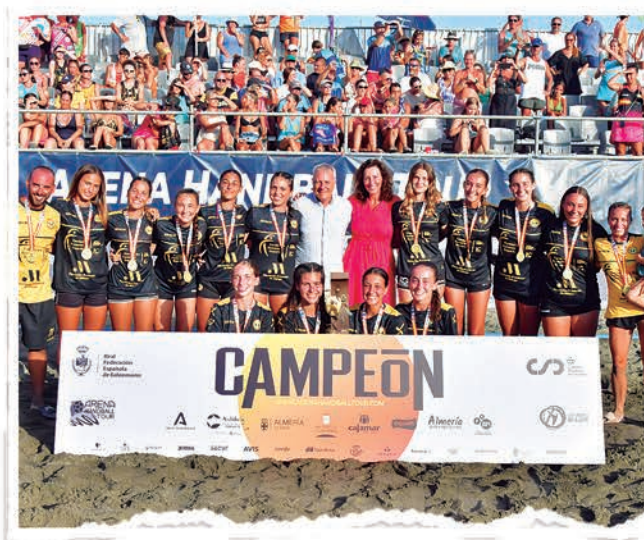
JUVENIL FEMENINO CIUDAD DE MÁLAGA