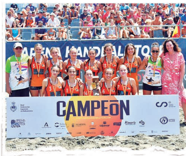
INFANTIL FEMENINO ELECTROBOMBAS JÁVEA