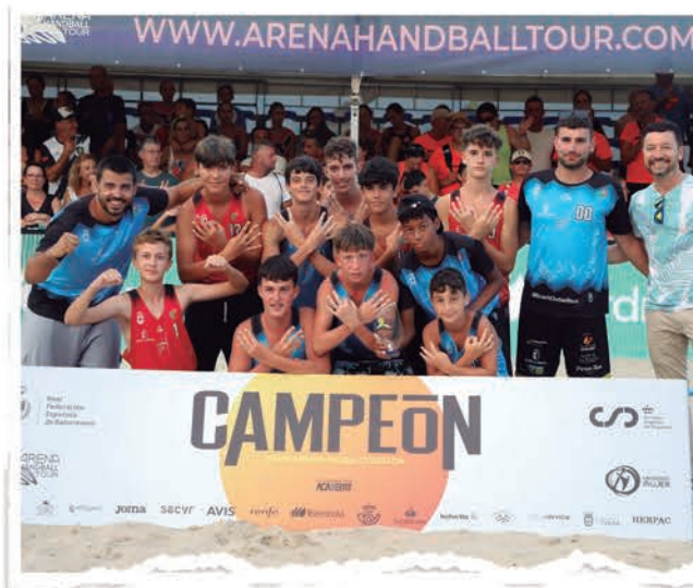
INFANTIL MASCULINO BEACH CIUDAD REAL