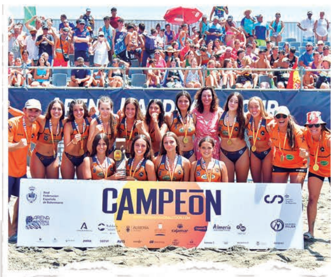
CADETE FEMENINO BMP MARAVILLAS BENALMÁDENA