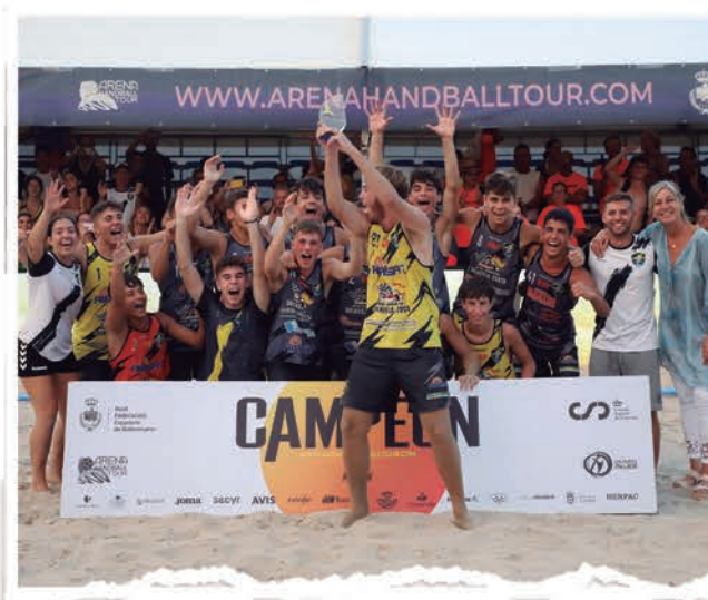
CADETE MASCULINO CBP RAYITO SALINERO.