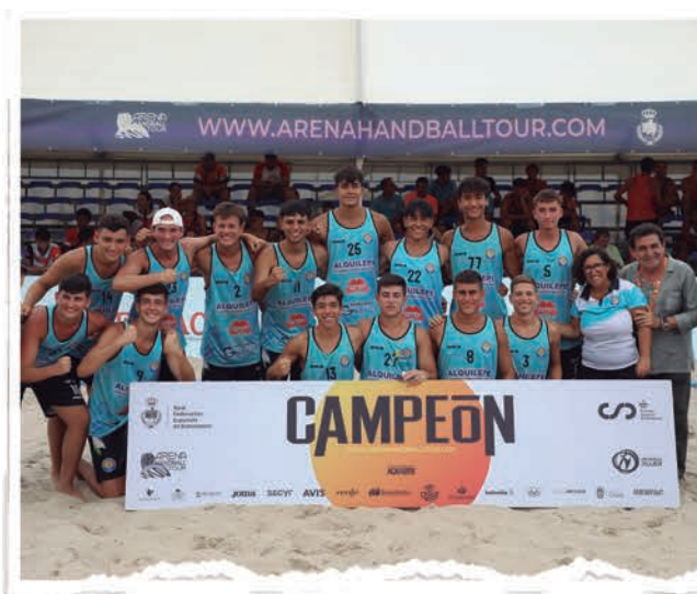
JUVENIL MASCULINO BMP ALQUILEPE