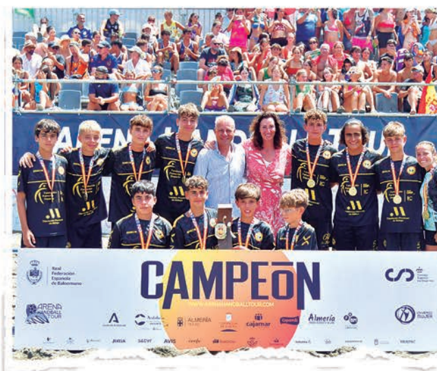
INFANTIL MASCULINO CIUDAD DE MÁLAGA