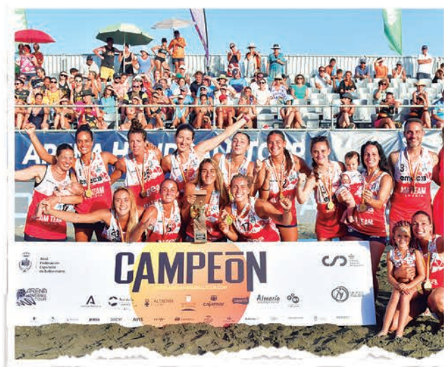
SENIOR FEMENINO CATS AM TEAM ALMERÍA

Se cerraba así este Campeonato de España Almería 2023, con CATS AM Team Almería y Ciudad de Málaga tomando el relevo de Movex Granollers y GEA AM Team Almería y poniendo fin a la fiesta más destacada del balonmano playa.