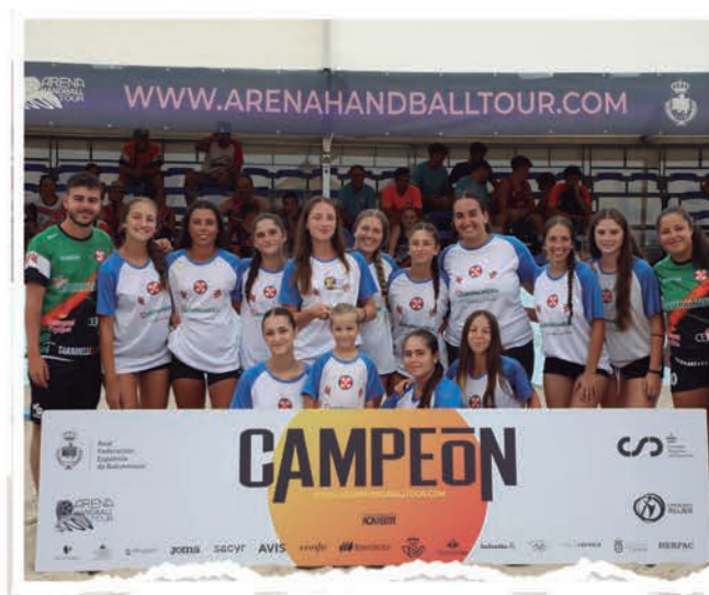
JUVENIL FEMENINO BMP URCI ALMERÍA AGRUPALMERÍA