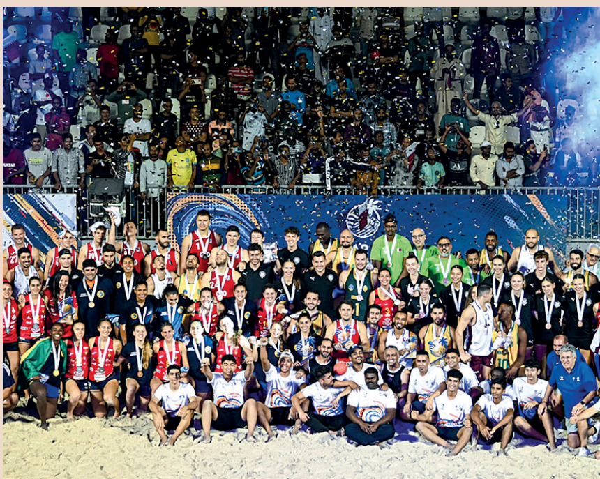
Las selecciones que consiguieron medalla en el IHF Global Tour 2024 posan sobre la arena de Doha.

En la final, Brasil no bajó el pistón. Y volvió a imponerse a Croacia , ahora por 2:0 (24:14, 23:14) para cerrar un 'doblete' de mucho nivel.